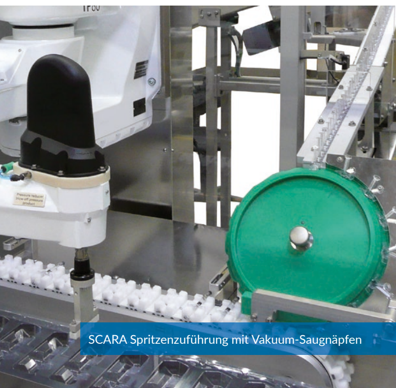
SCARA Spritzenzuführung mit Vakuum-Saugnapfen