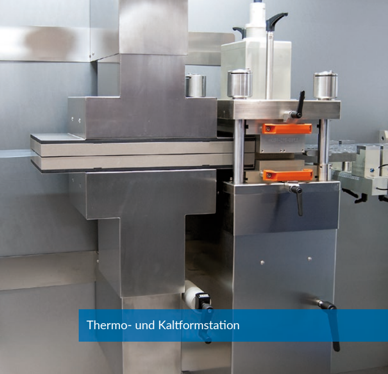
Thermo- und Kaltformstation